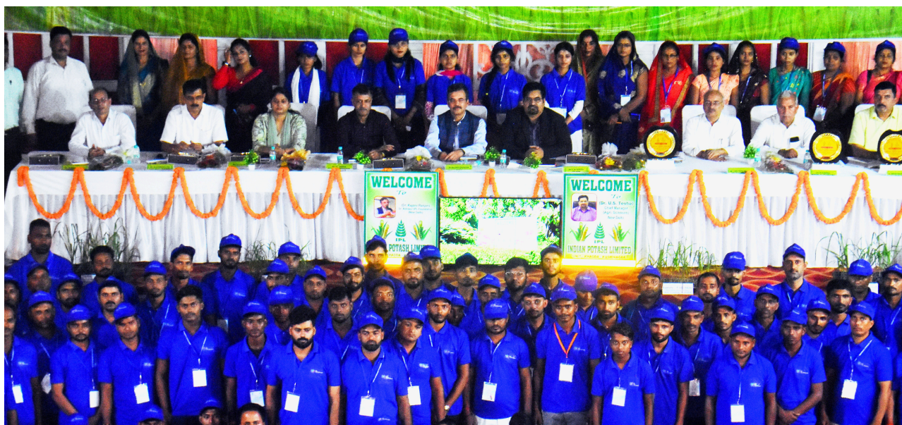
Orientation Programme in Khadda, Uttar Pradesh (18.10.2024)