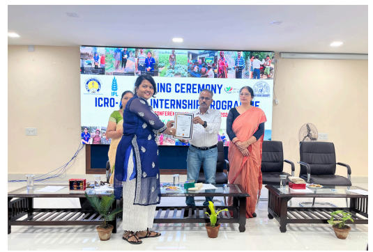
Closing Ceremony of Amrit Internship Programme at Fakir Mohan University, Odisha on 25th September, 2024