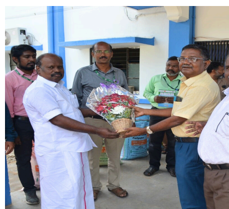
SNIPPETS OF THE MEGA FARMER'S MEET