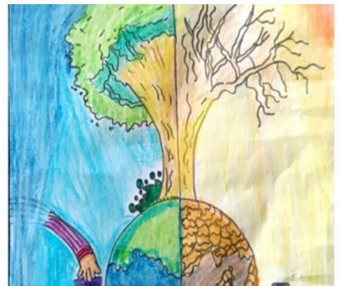
Kid's Corner at Udbhav Shiksha Niketan, Jarwal Road, Uttar Pradesh