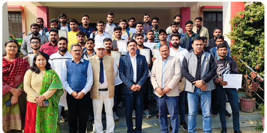
Closing Ceremony of Amrit Internship Programme at KVK Muzaffarnagar, UP on 22nd November, 2024