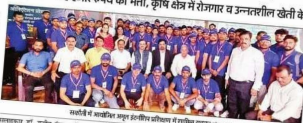
सकौती में आयोजित अमृत इंटरनशिप प्रशिक्षण में शामिल युवा।